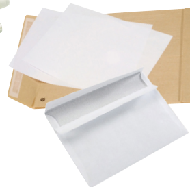
Print- en schrijfpapier