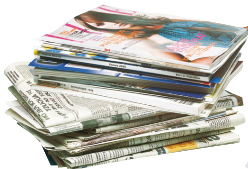
Tijdschriften, kranten en boeken