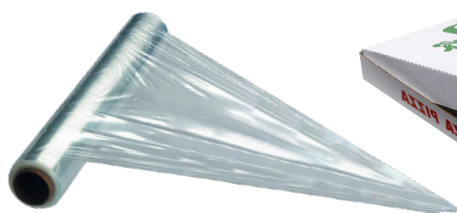
Plastic folie als verpakking rond tijdschriften Cellofaanpapier