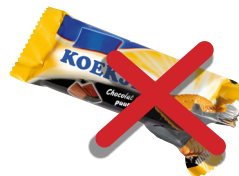
Vuil of vettig papier of karton