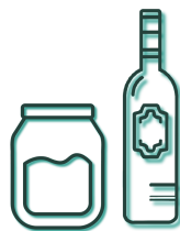
Flessen en potjes van glas (met etiket)

Verwijder altijd de dop of het deksel van glazen flessen en bokalen.