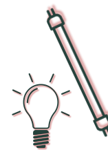
Lampen & TL-buizen