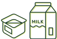
Melkproducten zoals yoghurt in potjes/tetrapack