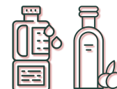
Vet & oliën