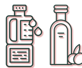
Vet & oliën