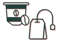
Koffiepads & theezakjes