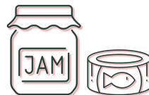
Verpakte levensmiddelen in blik of glas