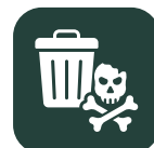
Gevaarlijk (chemisch afval)